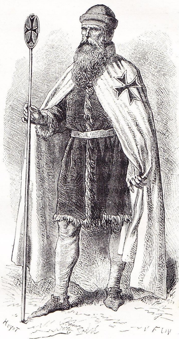
Lucas de Beaumanoir.

« Conrad, » lui disait Beaumanoir, « cher compagnon de mes combats et de mes fatigues, ce n'est que dans ton cœur dévoué que je puis déposer mes chagrins. Oui, à toi seul je puis dire combien de fois, depuis mon arrivée dans ce royaume, j'ai souhaité d'être réduit en poudre et rappelé au sein des justes ! Je n'ai rien vu en Angleterre où reposer mes